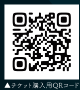
▲チケット購入用QRコード

WEB販売 世田谷サービス公社オンラインチケットサービス https://www.cnplayguide.com/setagaya/